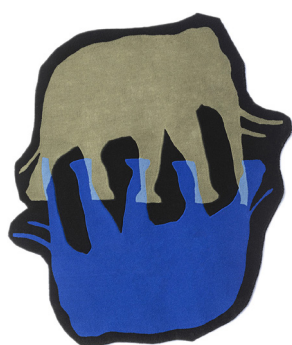
EM 01 v.1