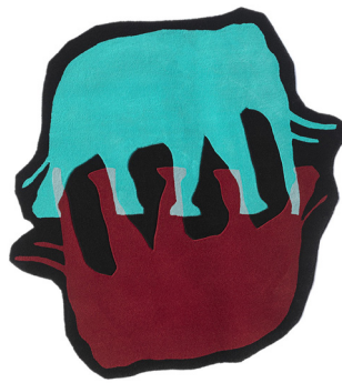
EM 01 v.2

I dati forniti in questa scheda tecnica sono aggiornati al momento della pubblicazione. Carpet Edition si riserva il diritto di modificare materiali, dimensioni e caratteristiche senza preavviso. The data provided in these technical specifications are up to date at the time of publication. Carpet Edition reserves the right to modify materials, sizes and characteristics without notice.